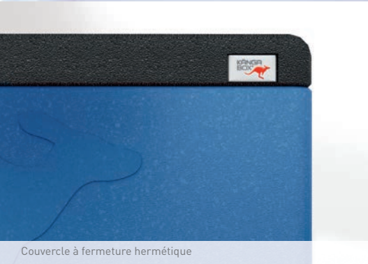
Couvercle à fermeture hermétique