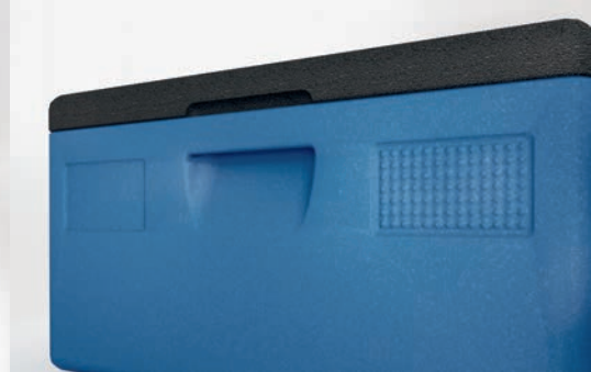
4 zones d'étiquetage