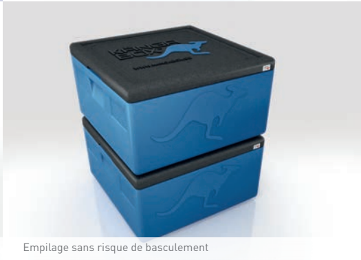
Empilage sans risque de basculement