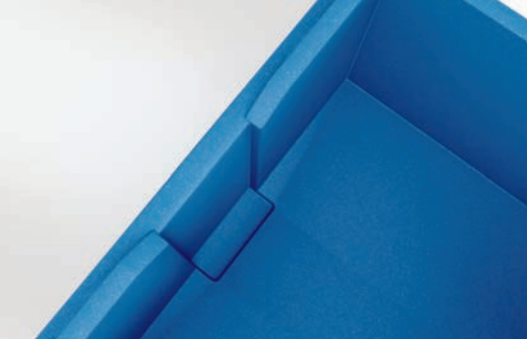
Rainure de préhension pour un enlèvement facile