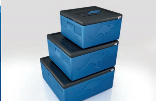
3 variantes de tailles